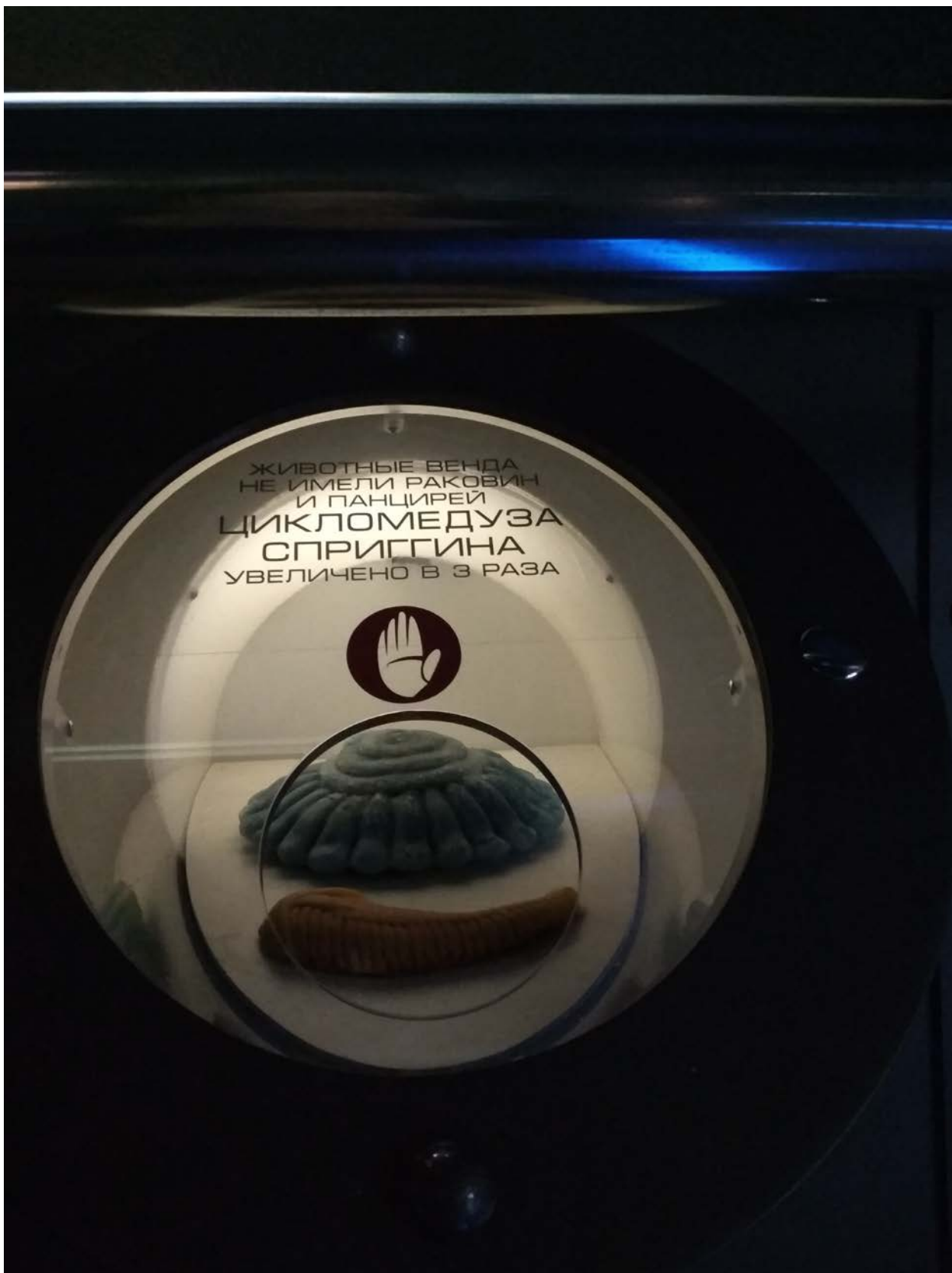
Тактильный экспонат на выставке.