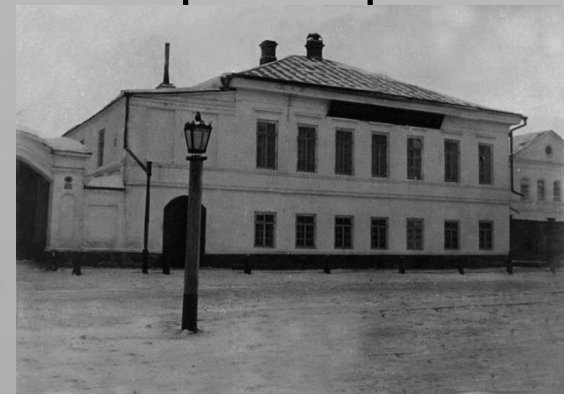
Красноярский Владимирский приют