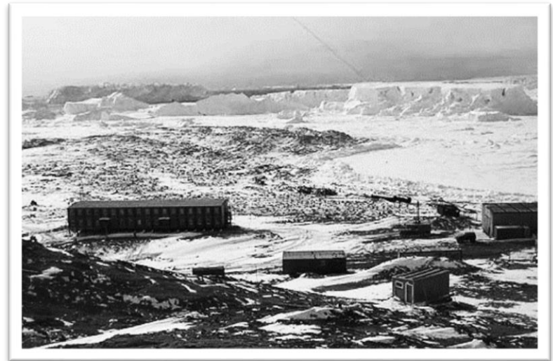
Антарктическая станция — Новолазаревская

Во время первой зимовки на ней произошло событие, сделавшее 27-летнего хирурга известным на весь мир.