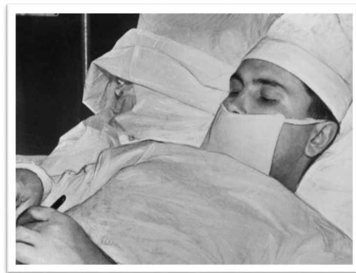
Леонид Рогозов во время операции

Чтобы спасти жизнь заболевшего полярника, необходима была срочная операция на месте. И единственным выходом в сложившейся ситуации было делать операцию самому себе.