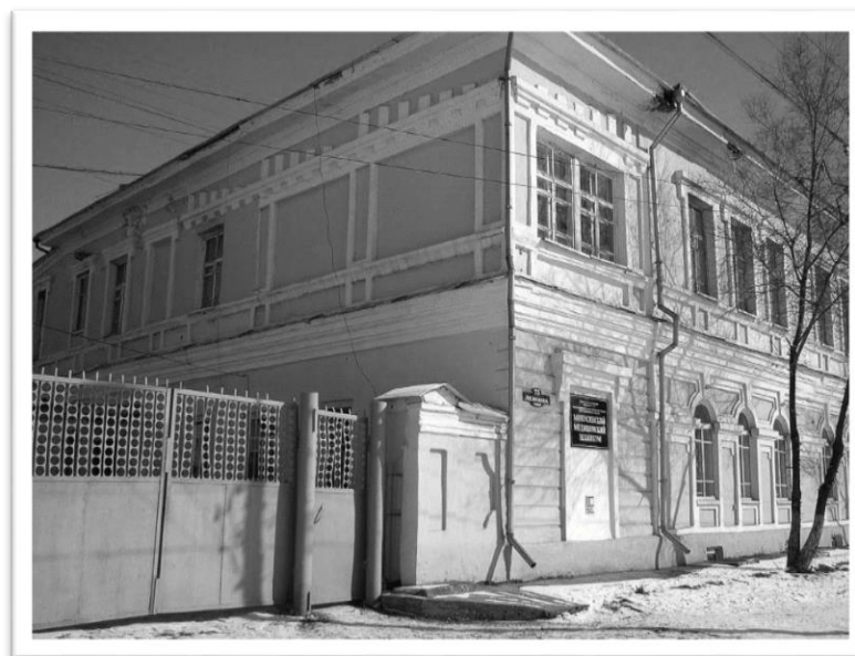
Школа №4 г. Минусинска. В здании сейчас расположен главный корпус Минусинского медицинского техникума