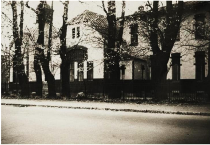
Ленинградский педиатрический институт

В 1959 году Леонид Рогозов окончил институт и сразу же был зачислен в клиническую ординатуру по хирургии. Однако обучение в ординатуре было на время прервано в связи с тем, что 5 ноября 1960 года Леонид отбыл на дизель-электроходе «Обь» в Антарктиду в качестве врача 6-й Советской Антарктической экспедиции.