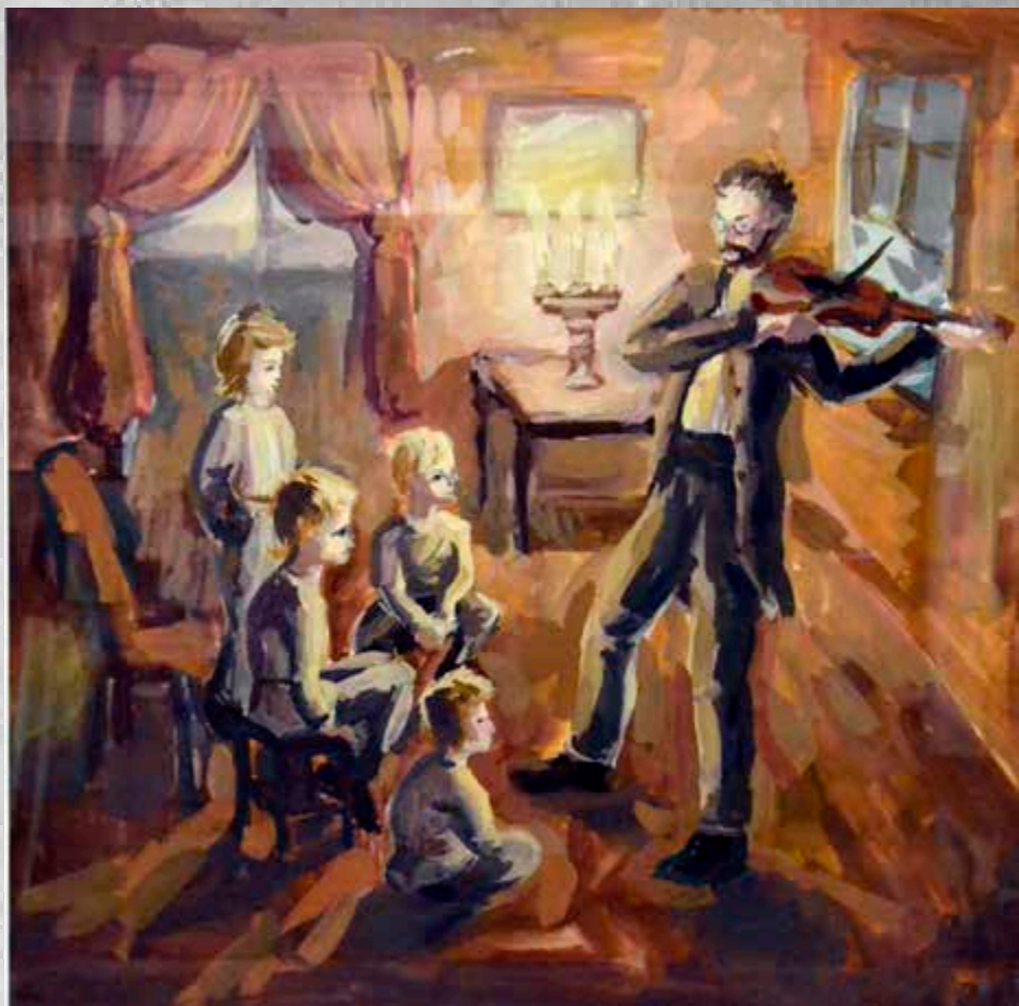
Перетятко Наталья, 13 лет "Уроки музыки" акварель, 42х42 см.