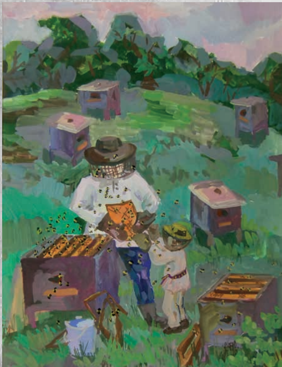
Потылицына Ася, 12 лет “На пасеке” акварель