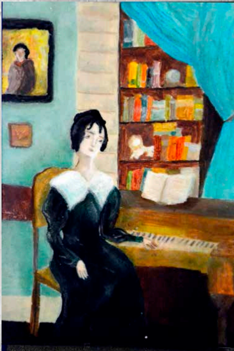
Зюзииков Александр, 13 лет "Портрет М.Н. Волконской" 10x15 см, лаковая миниатюра