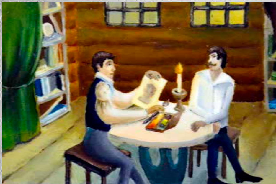
Коробкова Наталья, 12 лет “Н.А. Бестужев рисует портрет С.И. Кривцова” 15x10 см, лаковая миниатюра