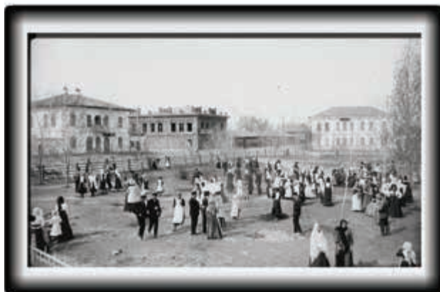
Праздник Древонасаждение, 1911 г.