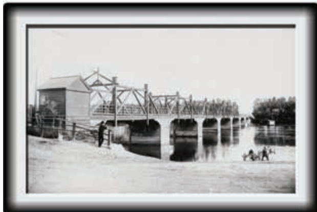
Мост через протоку р. Енисей, 1911 г.