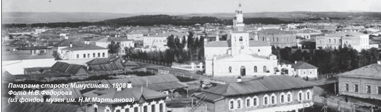
Панорама старого Минусинска, 1908 г.