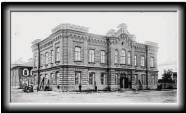
Минусинский публичный музей