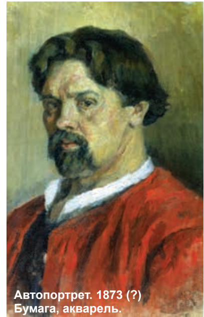
Автопортрет. 1873 (?) Бумага, акварель.

По происхождению и духу он был русским. Но, прежде всего, сибиряком, представителем сурового края,