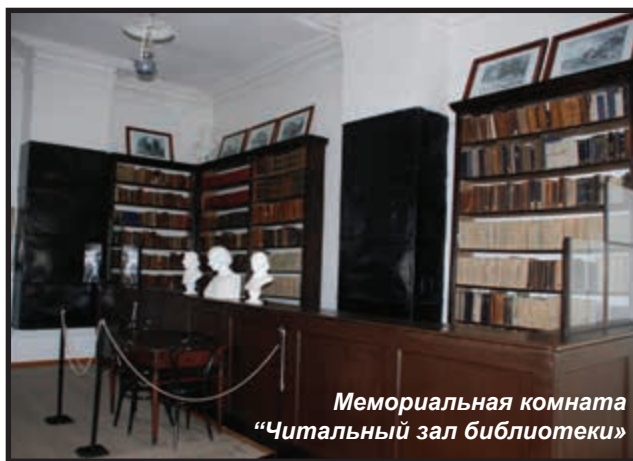
Мемориальная комната «Читальный зал библиотеки»

Городское управление отвело для нее одну из комнат на первом этаже бывшего дома купчихи М. Беловой (ныне медицинское училище). Работала библиотека ежедневно (с 15 до 19 час. по будням, с 13 до 17 час. по воскресным дням) кроме больших праздничных дней