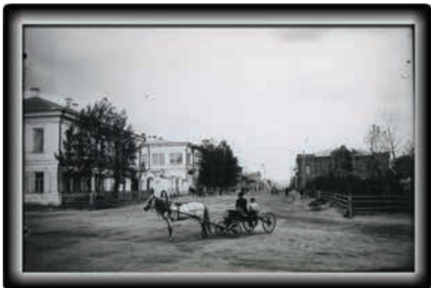
ул. Беловская (ныне ул. Ленина)