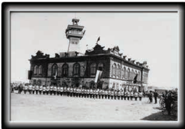
Смотр Добровольной пожарной дружины у здания Пожарного депо, где находился и местный театр (1909 г.)