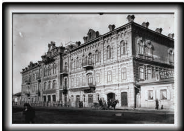
Дом Вильнера, 1915 г.