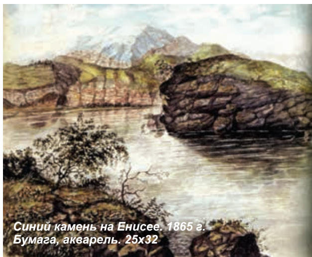
Синий камень на Енисее. 1865 г. Бумага, акварель. 25х32

сразу же рождают величественный образ могучей сибирской природы. Именно они, облака и горы, заставляют зрителя отвлечься от изображенного художником на первом плане неказистого, обветшалого забора».