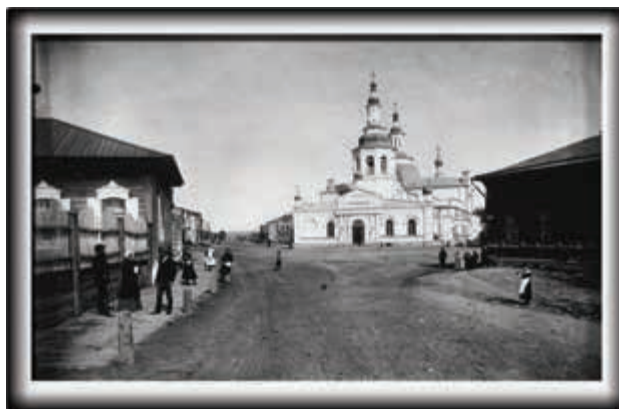
Спасский собор и Большая улица, 1908 г.

зав. отделом научно-справочного аппарата и использования документов архива г. Минусинска