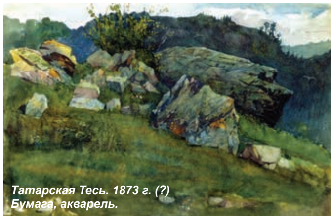
Татарская Тесь. 1873 г. (?) Бумага, акварель.