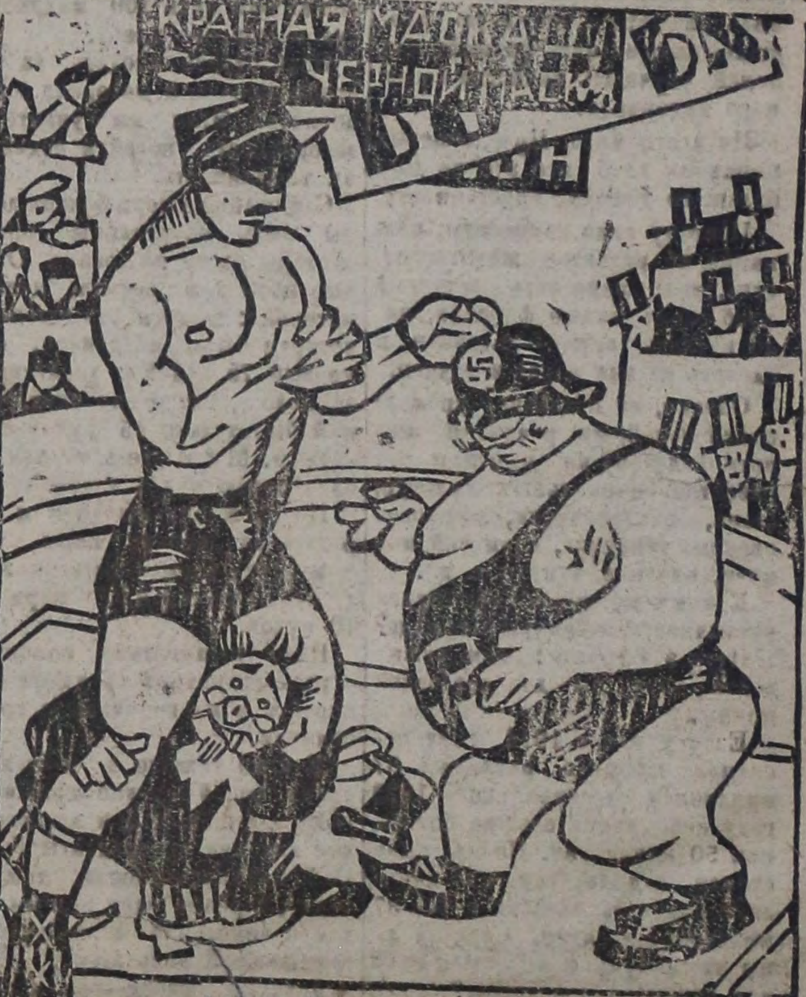
Германские рабочие (красная масса)

Как только начнешь бороться с этими чудовищами, так возматлей рыжий и д. ногам туг как тут!