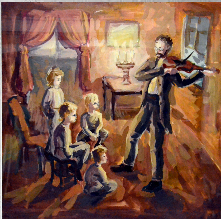
Перетьятко Наталья, 13 лет “Уроки музыки” акварель, 42х42 см.