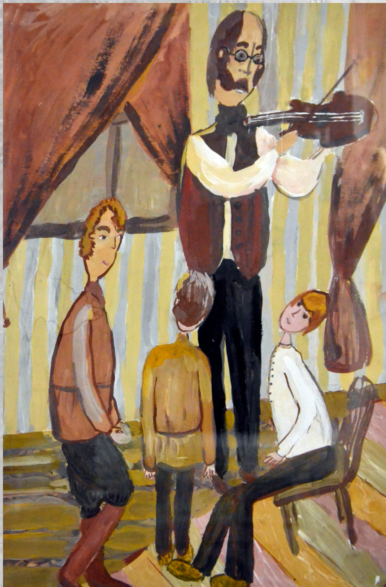
Полуян Милена, 10 лет “Н. Крюков и крестьянские дети” акварель, 32х46 см.