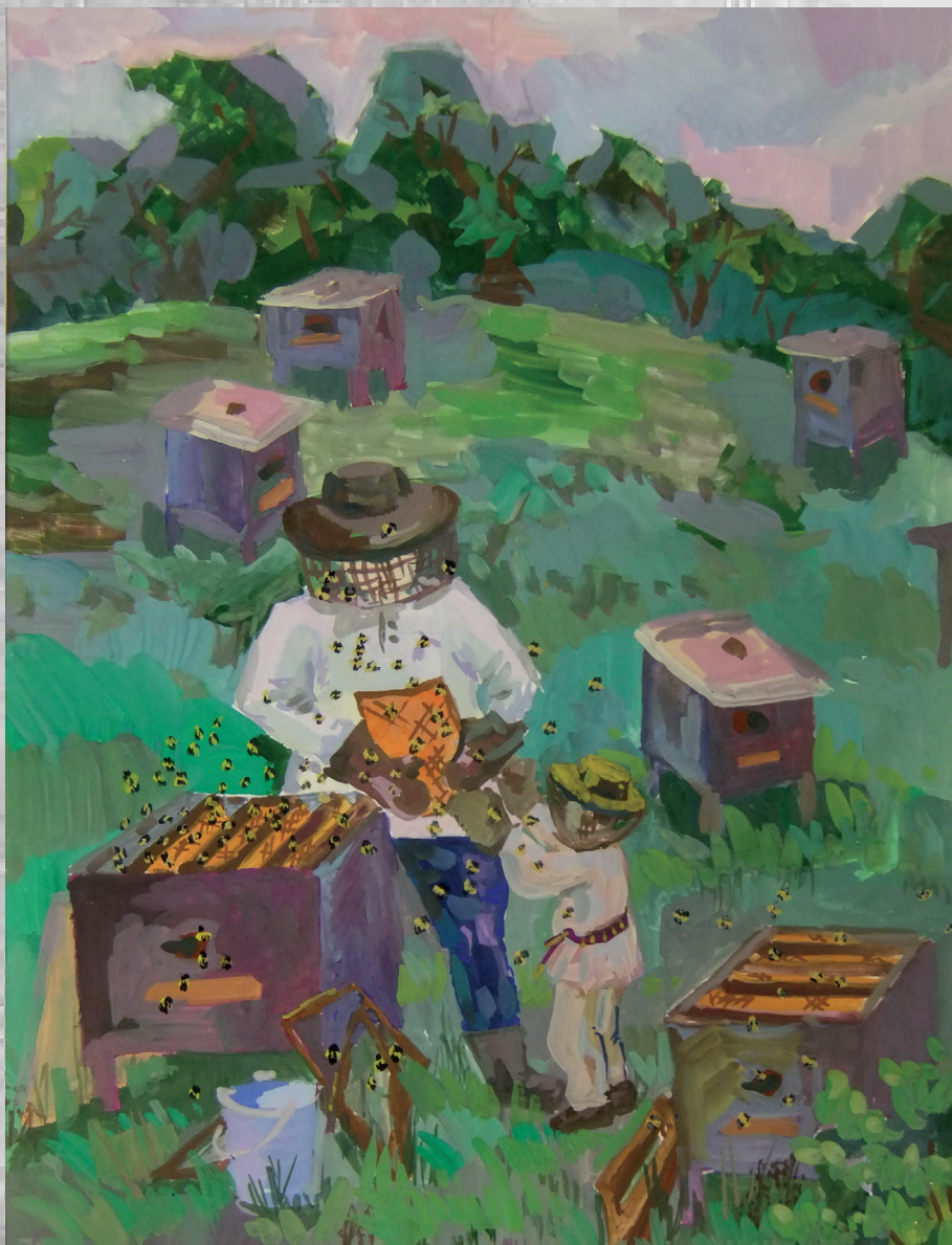
Потылицына Ася, 12 лет “На пасеке” акварель