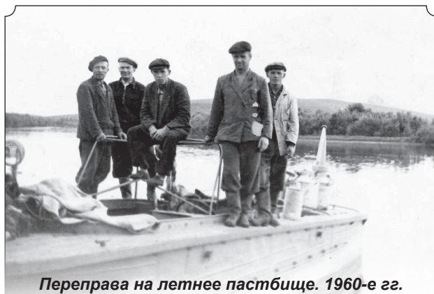
Переправа на летнее пастбище. 1960-е гг.

Е.А. НИКИФОРОВА, зав.отделом по музейно-образовательной деятельности