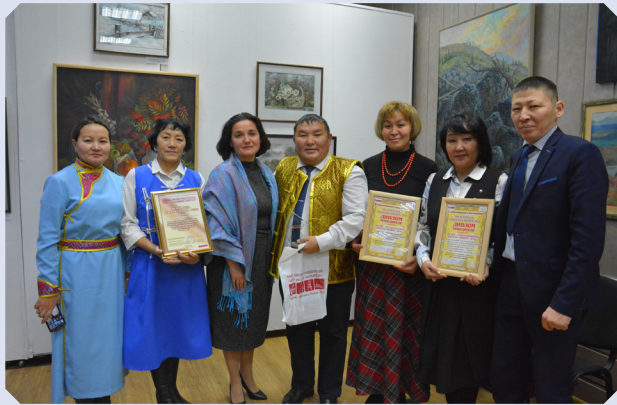
Номинанты – представители музеев Республики Тыва

Поэтому проект «Щербаковские чтения» при Та-скинской картинной галереи им. Ю.А. Бражникова будет жить».