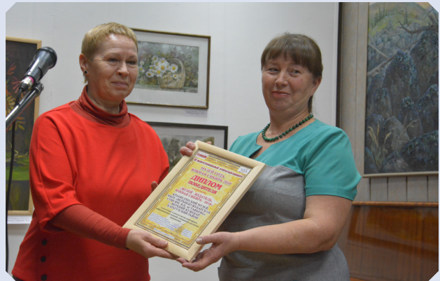
Представитель Краеведческого музея МОБУ Верхнекужебарская СОШ получает диплом победителя

Список «Подвижников музейного дела» пополнился двумя людьми, которые были достойно