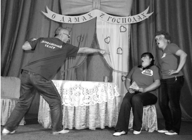
Сцена из спектакля «О Дамах и Господах».

ЛЕ народного творчества «Созвездие талантов». Итогом стал диплом «Лауреата III степени» в номинации «Театральный миллениум».