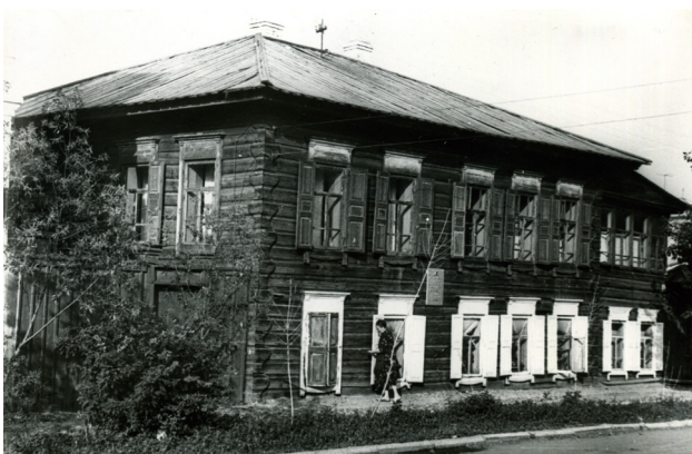
Мемориальный дом-музей «Квартира Г.М. Кржижановского и В.В. Старкова». 1970-е гг.

Начало положила выставка самоваров из фондов нашего музея, а далее были «Часы и календа-