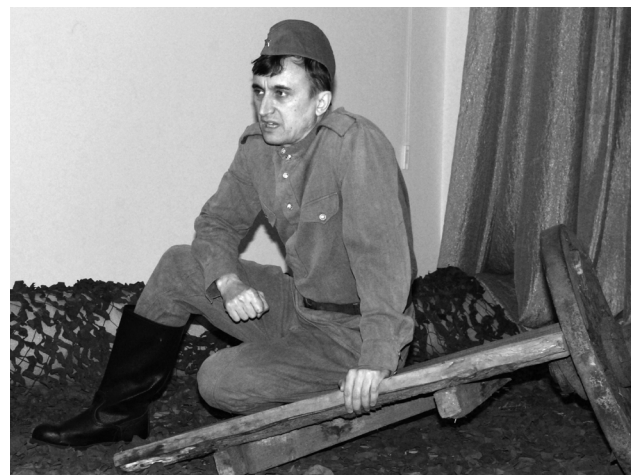
Сцена из спектакля «Не забудут народы, кто истинный был герой...»

Перед театральной студией ставились основные цели и задачи по привлечению посетителей, их приобщению к общечеловеческим ценностям и ценностям театрального искусства. А также развитие творческого потенциала сотрудников музея и повышение исполнительского мастерства.