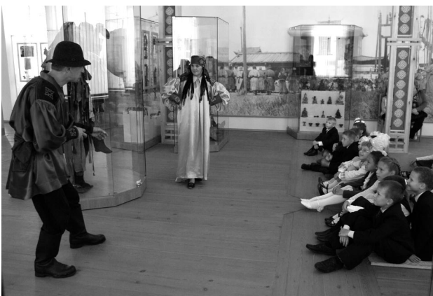
Сцена из театрализованного мероприятия «Музейная книга сказок: хакасские и китайские народные сказки»