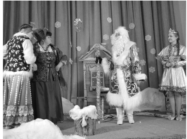
Сцена из сказки «Морозко».

В настоящее время репертуар «Домашнего театра Мартыановского музея» намного расширился. В нём представлены моноспектакли И.В. Германа: «Только тот подвиг свят», по воспоминаниям А.П. Беляева; «Ода чемпиону», по повести М. Зощенко «Деньги»;