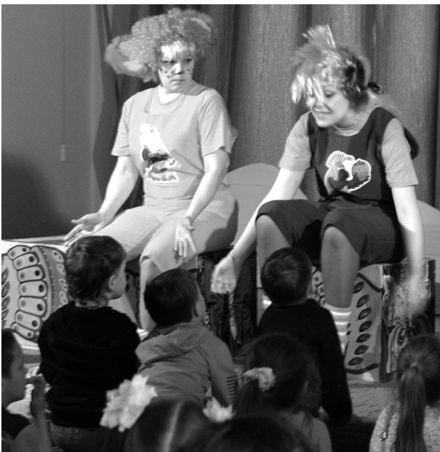
Сцена из спектакля «Привет Мартышке!»

Весной 2013 года началась работа по постановке нового спектакля «О Дамах и Господах» по пьесам А.П. Чехова «Предложение» и «Юбилей», премьера которого состоялась 13 сентября. Постановка оказалась не менее удачной, мастерство актёров тоже выросло и во Всесибирском фестивале любительского театрального искусства «Рампа на Енисее» (Крас-