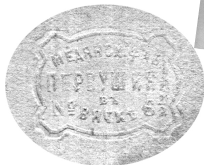
Картинки из игры «убчур» и оттиск на бумаге одной из них «Медянск. фаб. Первушина К° в Вятке 6 1/2»

дественен. Имеющий картинку льва кладет её; каждый из играющих, должен положить тут же количество картинок, по цене равное льву, то есть на шестьдесят четыре лана. Если у кого-либо окажется нехватка, она пополняется ланами по числу недостающих очков. После льва кладётся тигр, затем, барс и т.д. Весь выигрыш получает тот, у кого окажется самое большое количество очков.