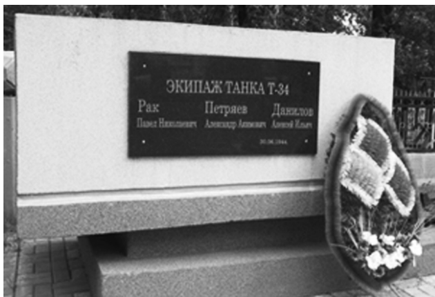
В этой братской могиле покоятся прах защитников города Борисова.