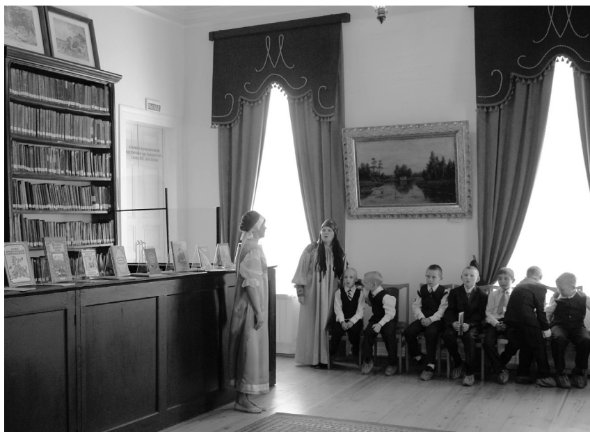
Интерактивная костюмированная экскурсия «Музейная книга сказок» в мемориальной комнате «Читальный зал библиотеки музея».

В День знаний юным посетителям представилась возможность при помощи художника разработать свой личный знак – эксплибрис. Мероприятие сопровождалось