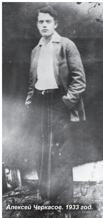
Алексей Черкасов. 1933 год.

Позже в «Сказаниях о людях тайги» Черкасов описал тюрьму на Тагарском острове, куда совершили поездку его герои Юсковы и встретили колонну этапированных арестантов: «А солнце всё так же полоскало негреющими осенними лучами краснокирпичную трёхэтажную тюрьму, в некотором роде – оплот и крепость Минусинска». Другой герой повествования – ссыльный доктор Иван