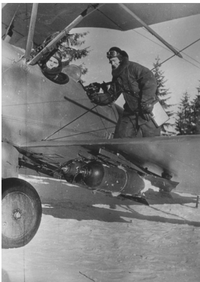
Легендарный самолёт У-2

Как известно, У-2 почти невозможно было ввести в штопор; в случае, если лётчик отпустил рули управления, самолёт начал планировать со скоростью снижения 1 метр в секунду и, мог самостоятельно сесть на ровную поверхность. Этот самолёт совершал посадку и поднимался в воздух буквально с грунтового «пятячка», для него требовалось крайне мало места для разбега, что делало его незаменимым для связи с партизанами. К тому же У-2 обладал низкой скоростью и поэтому мог летать на небольших высотах, тогда как более скоростные самолёты рисковали при этом вреяться в холмы, деревья, складки местности. Это позволяло использовать машину для штурмовок и бомбардировок вражеских позиций. Но днём самолёт становился лёгкой добычей для истребителей противника и, особенно, уязвим для ЗА (зенитной артиллерии). Его можно было подбить даже из стрелкового оружия, поэтому полёты совершались, в основном, ночью. У-2 широко применялись для так называемых «беспокоящих на-