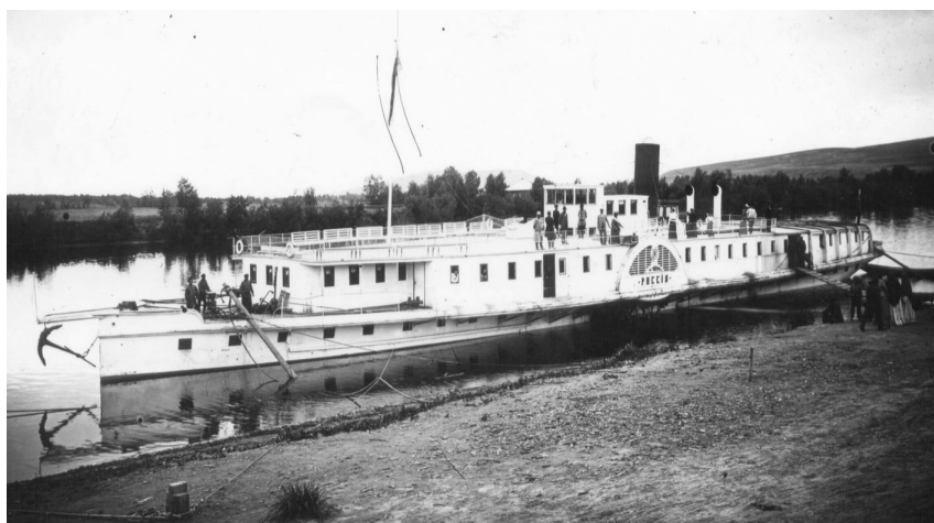
Пароход «Россия» у причала. Минусинск, нач. XX в.

И, наконец, это Минусинский драматический театр, осуществивший замечательную постановку по роману-трилогии «Хмель» в 1983 г. Спустя три года режиссёр-постановщик Валерий Пашнин, исполнитель-