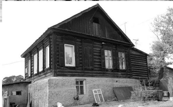
«Дом на дюнах». Минусинск, ул. Свердлова, 116. Фото Симкина А.З. Июнь 1995 г. и фото Л. Порошиной, 2010 г.

героев, нельзя не упомянуть старый деревянный мост и набережную протоки реки Енисей. С 1882 г. на минусинскую пристань прибывали пароходы из Красноярска «Св. Николай», «Дедушка» и «Россия», на которых путешествовали герои «Сказаний о людях тайги» Боровиковы и Юсковы: «Двухтрубный пароход, тяжело отдуваясь, как старик, и назывался «Дедушкой», медленно двигался навстречу течению возле аспидно-чёрных утёсов по правому борту. Ни звёзд, ни неба; чугунная плита. Давящая, гнетущая». «Медленно, на ощупь, с промерами дна