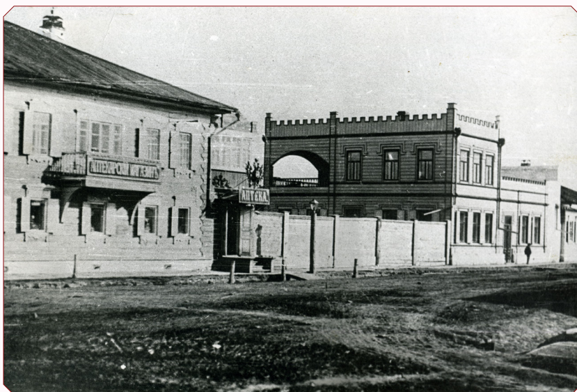
Аптека Н.М. Мартьянова на ул. Гоголевской. 1905 г.

За рекордно быстрые сроки – 2,5 года было выстроено собственное двухэтажное здание для коллекций музея и его библиотеки по проекту иркутского архитектора В.А. Рассушина. В мае 1890