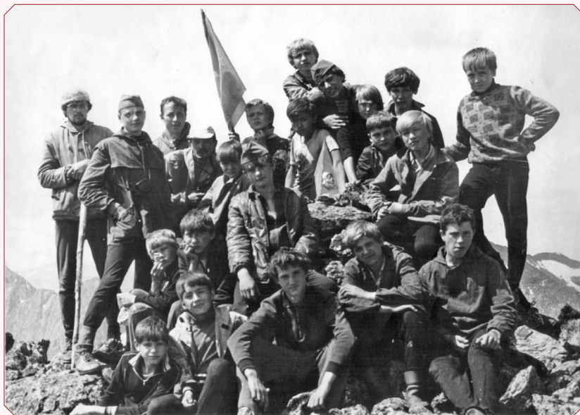
На пике Мартьянова. 1984 год.

В.В. Ермилова, н. с. научно-фондового отдела