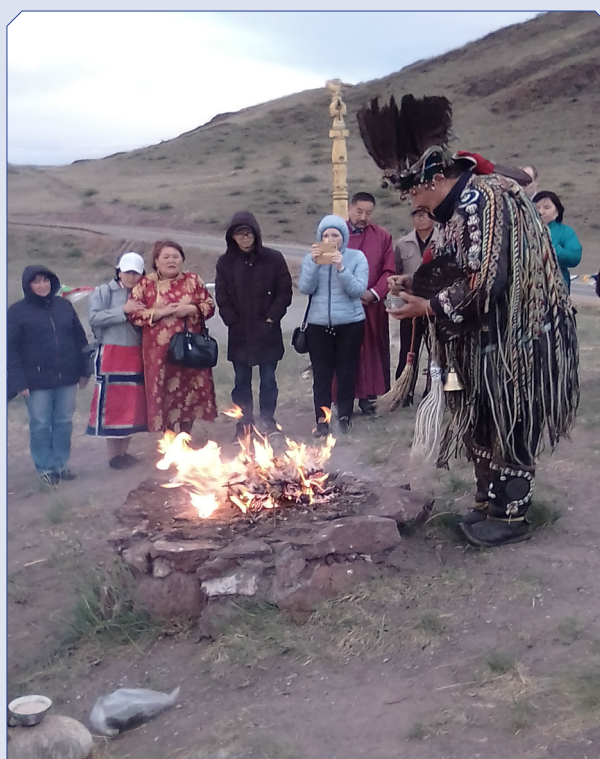
Шаманский обряд «Зов духов». 23 мая 2019 г.