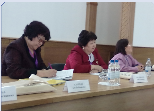
Пленарное заседание научно-практической конференции «III Ермолаевские чтения», 24 мая 2019 г.

Завершался день Торжественной частью, посвящённой 90-летию основания Национального музея им. Алдан-Маадыр РТ в Доме народного творчества. На следующий день участники конференции и юбилейных мероприятий побывали на торжественном открытии Этнокультурного музея-заповедника «Бельдир-Кежи». Познакомились с продукцией на ярмарке местных производителей Улуг-Хемского и Чаа-Хольского кожуунов, посетили мастер-классы по приготовлению национальных блюд и национальным видам игр, соревнования по стрельбе из традиционного урянхайского лука.