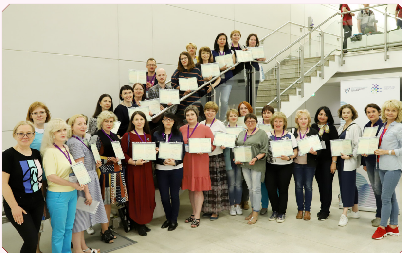
Победители конкурса «Музей без границ». г. Москва, 2 июня 2019 г.

По итогам стажировки слушатели защитили свои проектные решения в контексте реальных задач, стоящих перед музейным сообществом России и получили документ установленного образца о повышении квалификации от Национального фонда подготовки кадров.