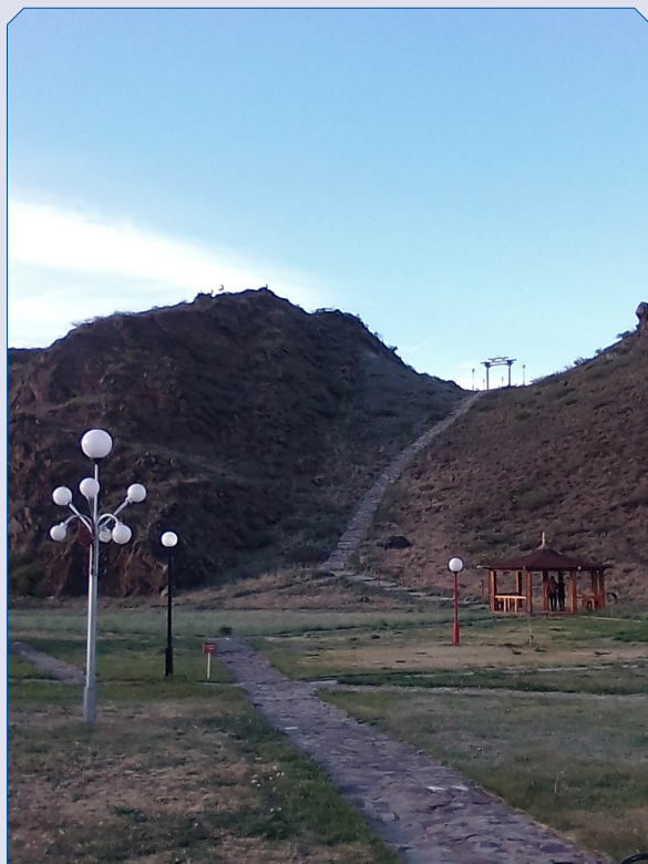
Комплекс «Алдын-Булак». Ворота Шамбалы.

Завершением вечерней экскурсии по Алдын Булаку стало