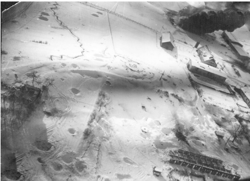
Результат штурмового удара 136 штурмового авиополка в районе Грюнвизе в Восточной Пруссии. 1945 год.

Все сложные операции (эффективное бомбометание, пуски реактивных снарядов, применение пушечного и пулемётного огня) лётчик выполнял под углом