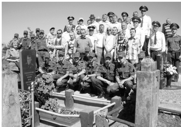
На могиле Героя. г. Лунинец Брестской области, Белоруссия.