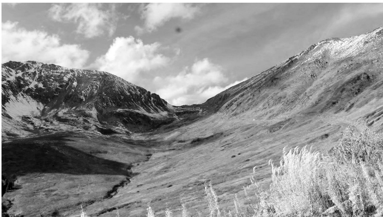
Через перевал в Ергаках к Чёрному озеру на Кундусук. Сентябрь 2015 г.