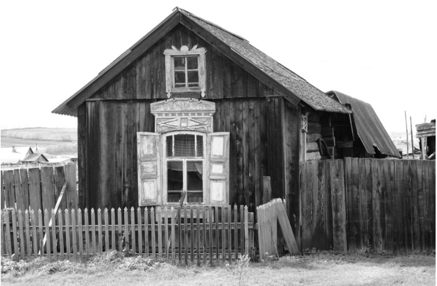
Дом с наличниками по ул. Советская в с. Алексеевка. Август-сентябрь 2015 г.