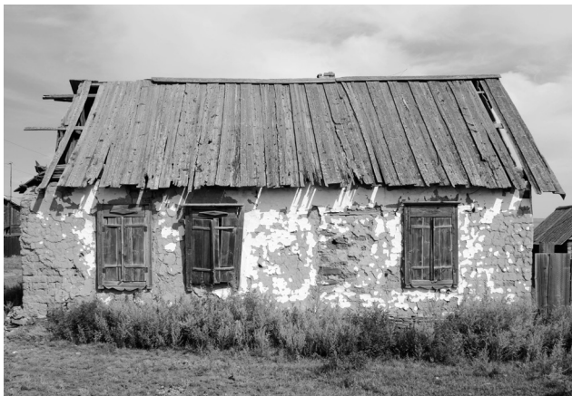
Саманный дом в деревне Николо-Петровка. Август-сентябрь, 2015 г.

традициях домостроительства, записали украинские народные песни. Как подарки и как случайные находки были получены предметы: плотничьи и столярные инструменты, орудия, использовавшиеся в производстве ниток и тканей, а также в сельском хозяйстве, кухонная утварь, одежда, украшения. Поступления датируются нач. – вт. пол. XX вв. и бытовали в украинских, русских и мордовских семьях.