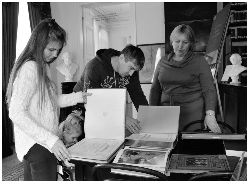
На выставке «Книжное искусство» посетители смогли познакомиться с раритетными изданиями, хранящимися в фонде научной библиотеки музея. 3 ноября 2015 г.

Любой вид деятельности можно назвать искусством в том случае, если исполнитель в полной мере вкладывает свои чувства в какую-либо новую интересную форму. Так участники акции на площадке «Прикосновение к древнему искусству» посетители узнали о памятниках древнего искусства и методах их изучения. А при проведении мастер-класса юным посетителям под руководством музейного археолога представилась возможность попрактиковаться в получении копий наскальных рисунков с использованием материалов, применяемых учёными-археологами.