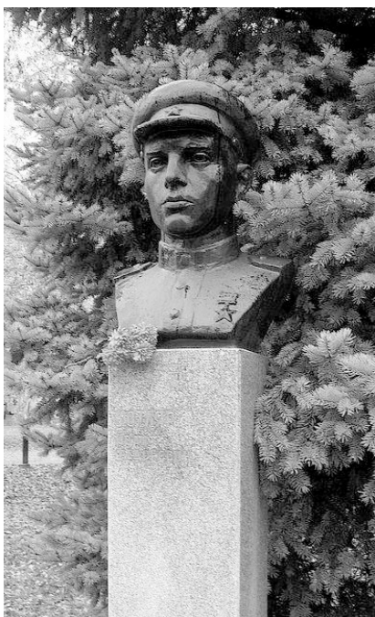
Бронзовый бюст героя в г. Тимашевск (Краснодарский край).

мально малыми потерями в людском составе и технике, первая форсировала реку Вислу в районе населённого пункта Вулька-Тарновска (Польша, Мазовецкое воеводство – ред.) взломала оборону противника