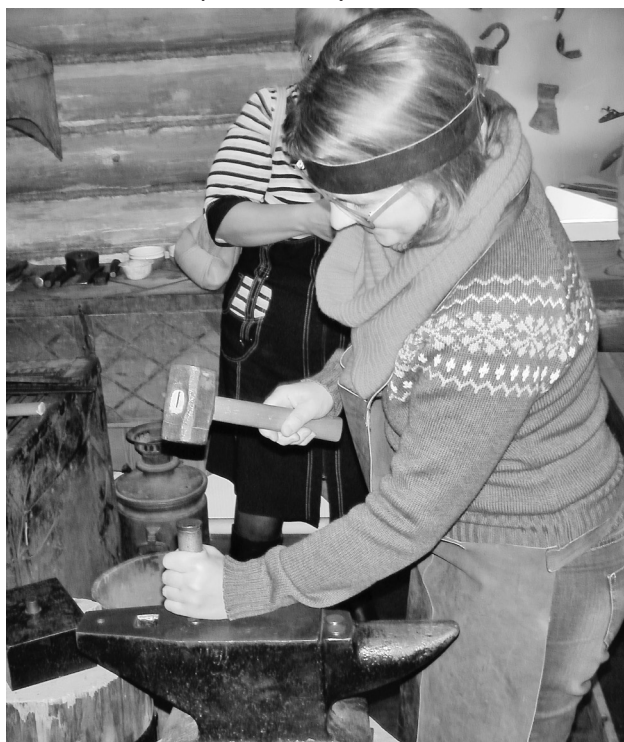
Интерактивное занятие по изготовлению чеканных памятных медалей с изображением герба г. Тулы в МВЦ «Тульские древности».