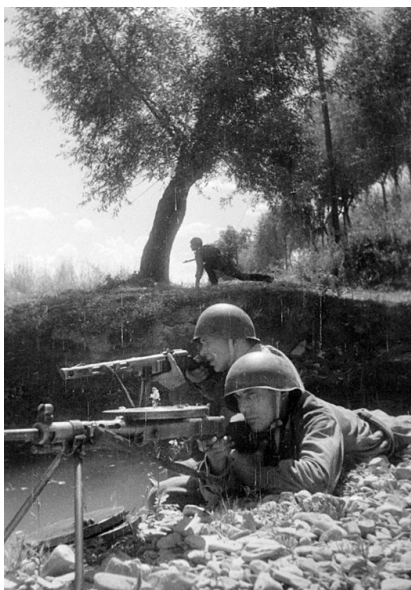
Бой за расширение плацдарма на левом берегу Вислы. 1944 г.

мально малыми потерями в людском составе и технике, первая форсировала реку Вислу в районе населённого пункта Вулька-Тарновска (Польша, Мазовецкое воеводство – ред.) взломала оборону противника