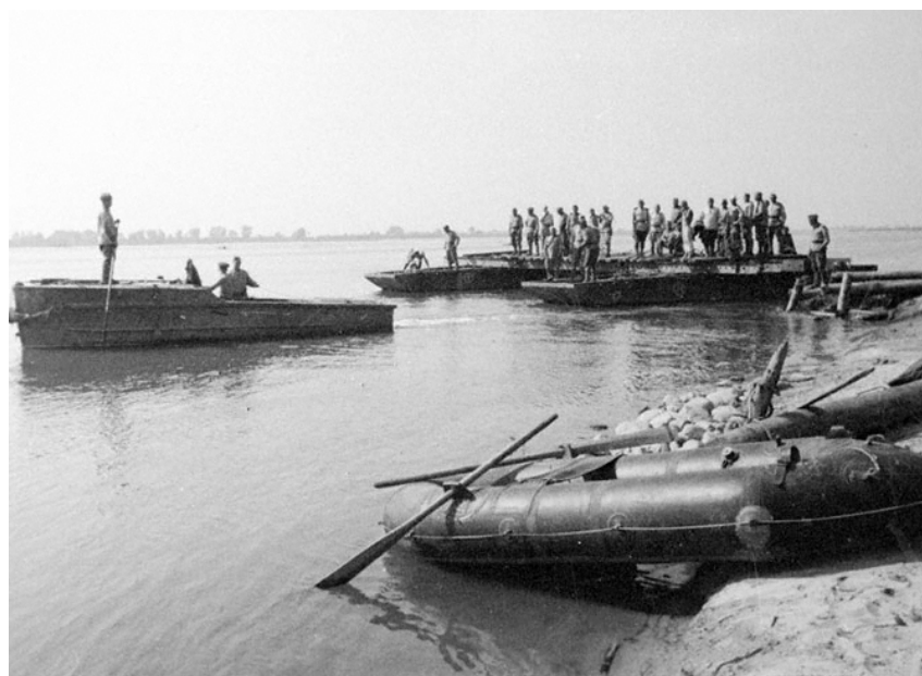
Переправа через Вислу. Польша. 1944 г.