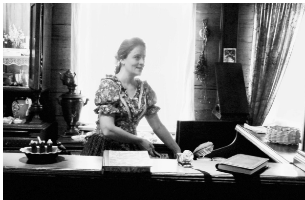
Приготовление настоящей пастилы для дегустации в музее исчезнувшего вкуса «Коломенская пастила» (г. Коломна).