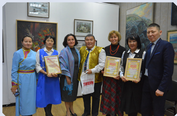
Номинанты – представители музеев Республики Тыва