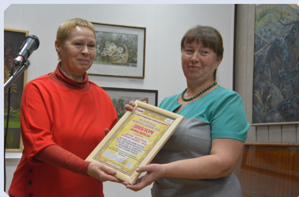
Представитель Краеведческого музея МОБУ Верхнекужебарская СОШ получает диплом победителя

Список «Подвижников музейного дела» пополнился двумя людьми, которые были достойно