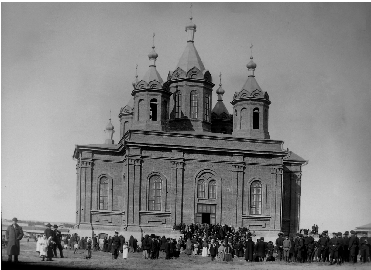
Вознесенская церковь. Нач. XX века.

вокруг – таков был красавец – храм, названный в честь Вознесения Господня. Созывали народ на богослужения 6 колоколов. 10