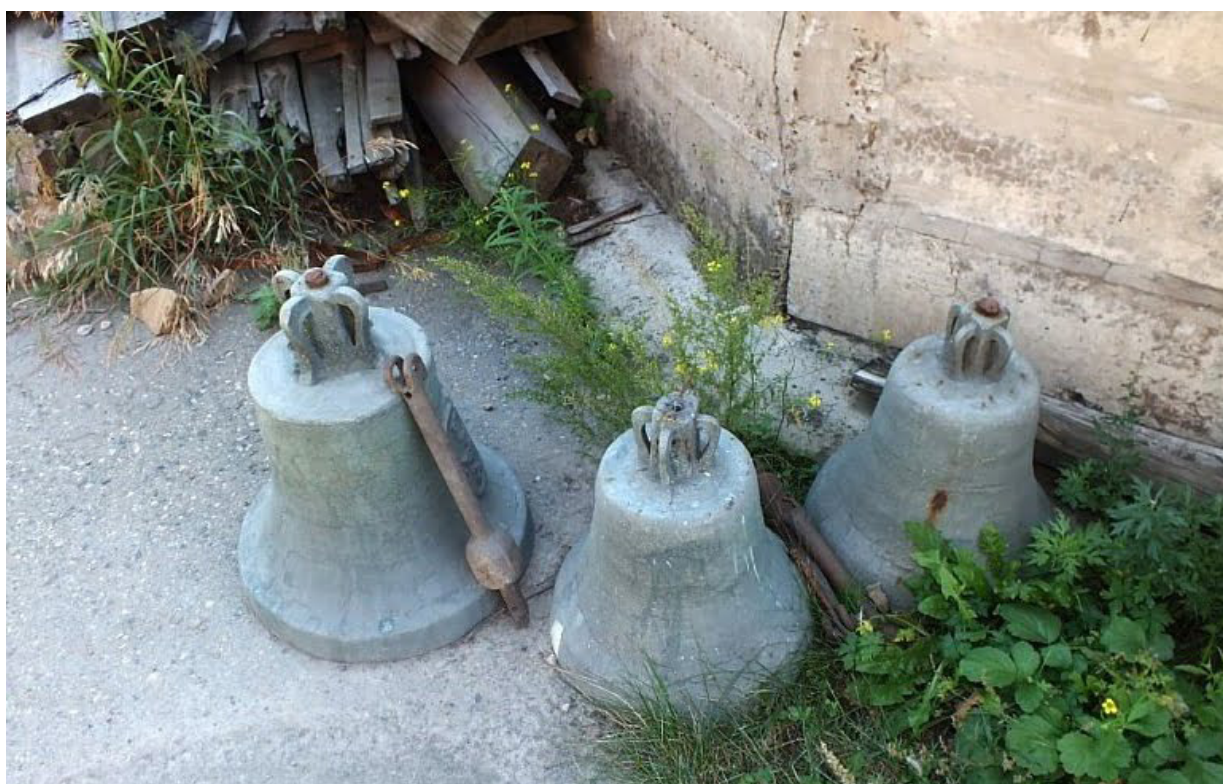
Вознесенская церковь сегодня.