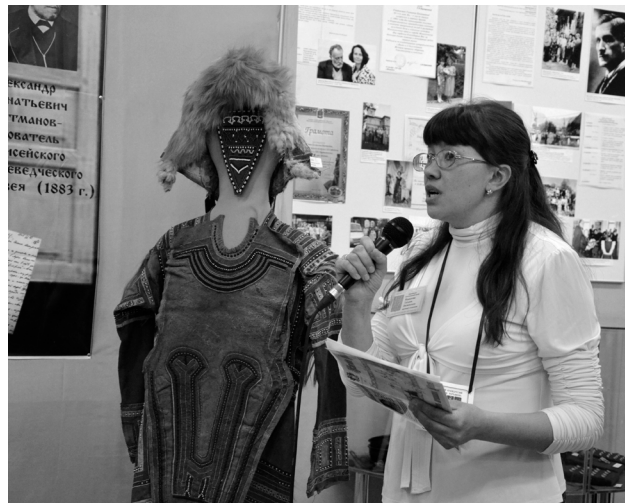
Представление экспозиции Енисейского музея на проекте «Музейная /Сибирь».

был направлен на привлечение внимания к проблеме сохранения и популяризации архивного кино как культурного наследия. Зрителям показали около 40 фильмов различной тематики, вызвавшие интерес у посетите-