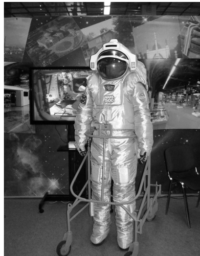
Фрагмент экспозиции Музея космонавтики

Ещё одно подтверждение тому, что наше музейное учреждение имеет отношение к разви-