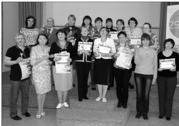
Победители конкурса «Музей года. Южная Сибирь-2012»