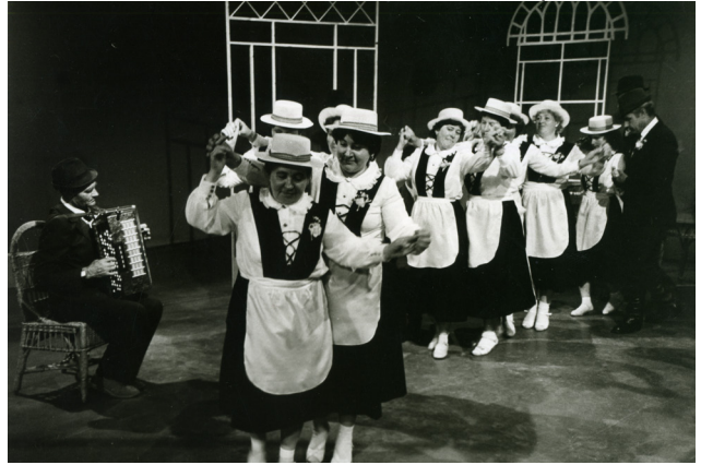
Фольклорная группа из с. Николаевка на Красноярском телевидении. Танец «хопса-полька». 1991 г.

В 1920-30-х гг. по немецким сёлам прокатилась