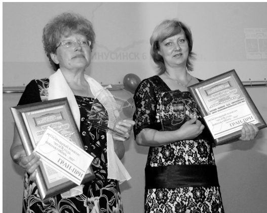
Обладатели Гран-При конкурса