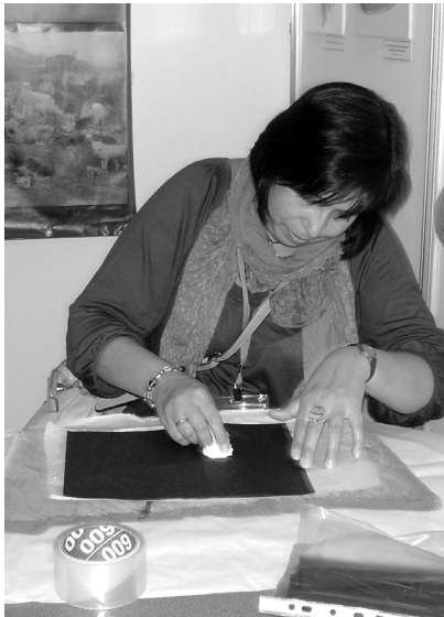
Мастер-класс по снятию копии с наскального изображения.

законодательстве, увеличения доходности музея с использованием современных билетных систем, проблемы создания Государственного каталога Музейного фонда, деятельности научно-методических центров Российской Федерации в переходный период и дальнейшие перспективы развития в новых организационно-правовых условиях, актуальные проблемы обе-