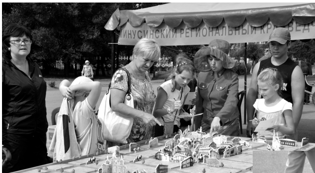
На площади перед краеведческим музеем им. Н.М. Мартьянова во время проведения акции