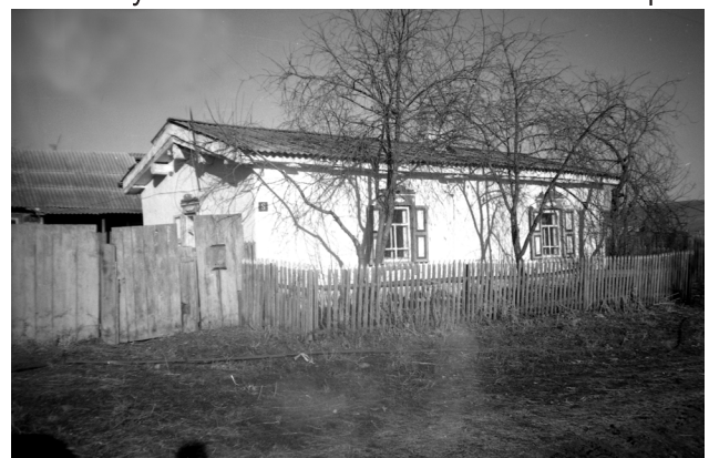
Дом, построенный из земляных пластов. с. Николаевка Краснотуранского района. 1992 г.

Одновременно с немецкими переселенцами на этот же участок стали селиться без всяких раз-