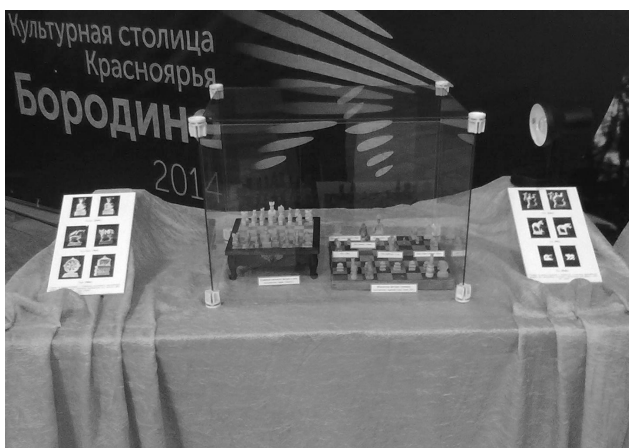
Фрагмент выставки «Шахматы. Люди. История» в ГДЦ г. Бородино. 20 февраля 2014 г.