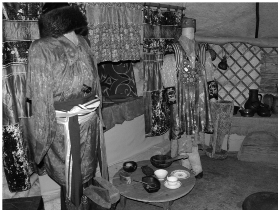
Фрагмент выставки - интерьер хакасской юрты.

наших регионов, особенно в свете сложившейся ситуации на Украине. Не случайно одной