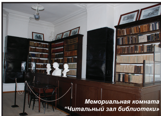
Мемориальная комната «Читальный зал библиотеки»

Городское управление отдало для нее одну из комнат на первом этаже бывшего дома купчихи М. Беловой (ныне медицинское училище). Работала библиотека ежедневно (с 15 до 19 час. по будням, с 13 до 17 час. по воскресным дням) кроме больших праздничных дней