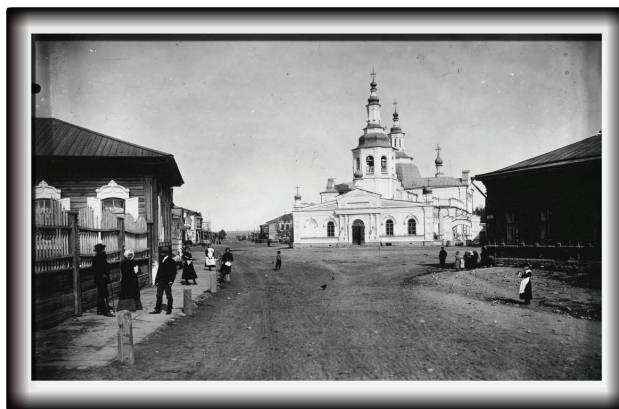
Спасский собор и Большая улица, 1908 г.

зав. отделом научно-справочного аппарата и использования документов архива г. Минусинска