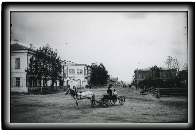
ул. Беловская (ныне ул. Ленина)