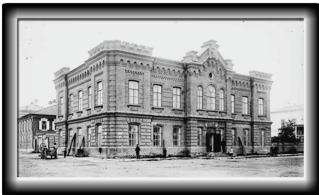
Минусинский публичный музей