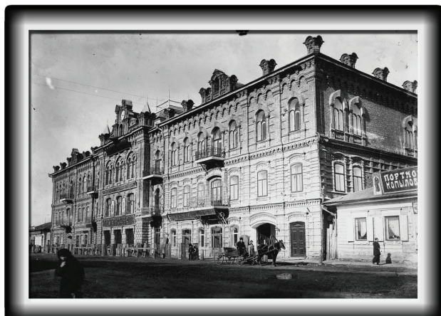
Дом Вильнера, 1915 г.