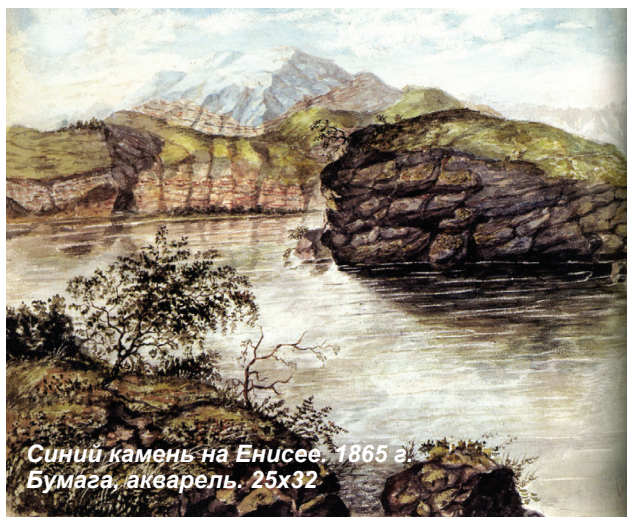
Синий камень на Енисее. 1865 г. Бумага, акварель. 25х32

сразу же рождают величественный образ могучей сибирской природы. Именно они, облака и горы, заставляют зрителя отвлечься от изображенного художником на первом плане неказистого, обветшалого забора».