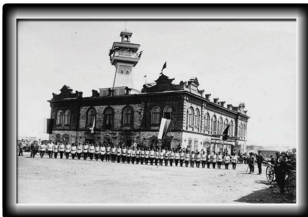
Смотр Добровольной пожарной дружины у здания Пожарного депо, где находился и местный театр (1909 г.)