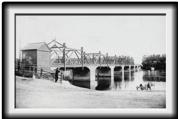
Мост через протоку р. Енисей, 1911 г.