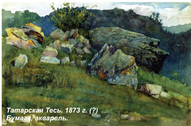
Татарская Тесь. 1873 г. (?) Бумага, акварель.