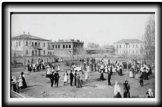
Праздник Древонасаждение, 1911 г.