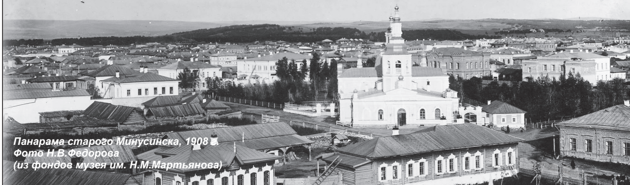
Панорама старого Минусинска, 1908 г.