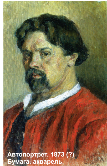
Автопортрет. 1873 (?) Бумага, акварель.

По происхождению и духу он был русским. Но, прежде всего, сибиряком, представителем сурового края,