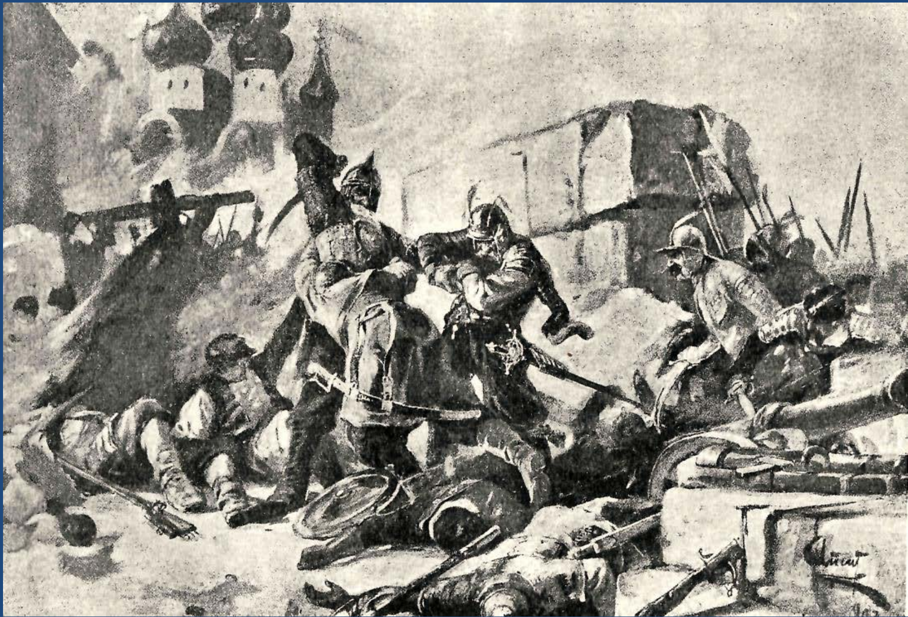
Воевода Шеин при защите Смоленска