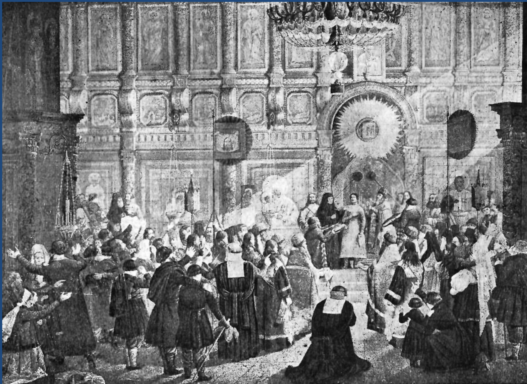
Воцарение Дома Романовых. Московское посольство перед Михаил Фёдоровичем