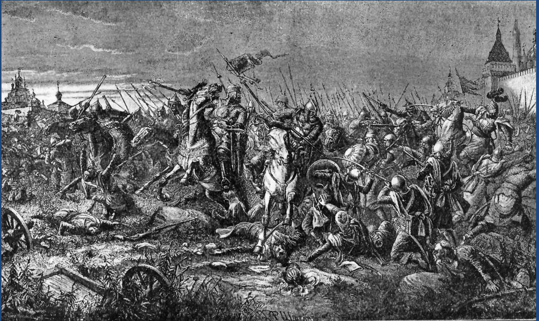
Кузьма Минин решает битву у Крымского брода