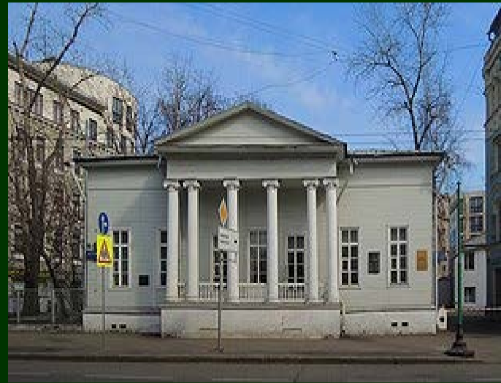
Москва. Остоженка, 37, музей И.С. Тургенева