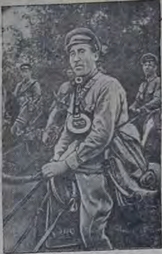
Действующая Армия. Близостро в боях за Советский Дон. Разбитый убитый немецкий солдат.

Полторацкий и Орлов. Когда они вошли в хату, хозяйка с испуганным видом смотрела на вих и все время повторяла: — Ведь вы же свол! Вы свол! На коленях у нее сидел мальчик и завязывая тряпьем шею были замечены вожделенные бойма. Когда хозяйка вышла приготовить постель гостям, мальчик сидел на стуле. Один из бойцов, раздеваясь, хотел повесить свой пояс. Все было занято вещами.