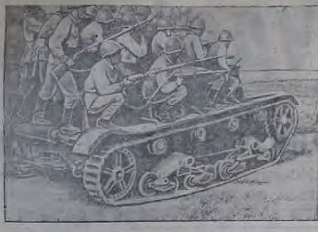
Лейтенант Армия НА СНИМКЕ: тактический десант на воздушной поддержке.

ОРГАН МИНУСИНСКОГО РАЙОНА И ГОРКОМА ВКП(б) РАЙОННОГО И ГОРОДСКОГО СОВЕТОВ ДЕПУТАТОВ ТРУДЯЩИХСЯ