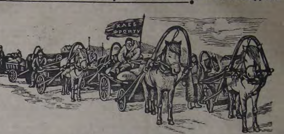
Хлеб-фронт, - под ударом колхозов района организация красные обмолоты с хлебом государству. Объя с хлебом из колхоза «10 лет РККА» убрала на заготовку.