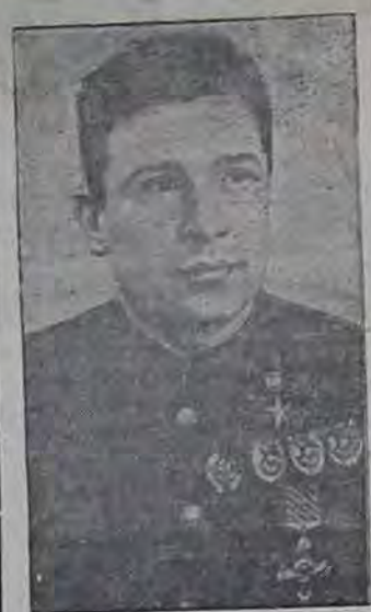
НА СНИМКЕ: младший Герой Советского Союза полковник Е. В. Сафонов, сбитый в воздушном бою 20 августа советских летчиков, награжденных орденом правительством органов.

Южнее Краснодара бойцы одной нашей части нанесли контратаку на позиции противника.