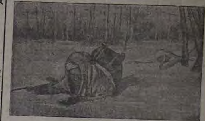
Действующая Армия (Западный фронт). На снимке: Армия вступила на территорию освобожденной территории.