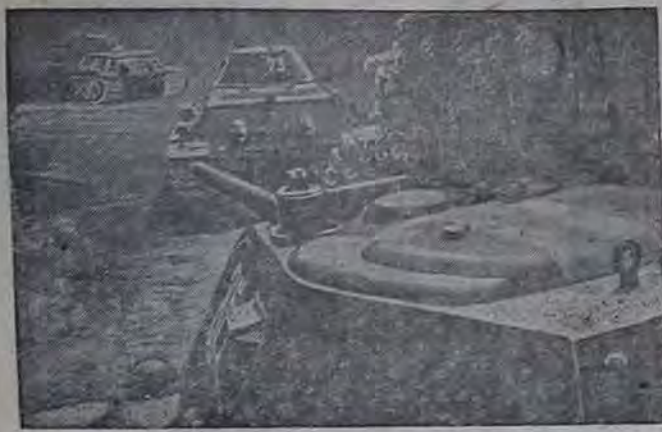
Действующая армия. НА СНИМКЕ: Советские тяжелые танки на марше.