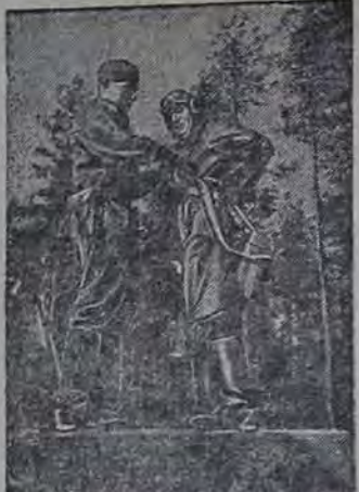
Лейтенант Армия. Летчик старшего лейтенанта И. А. Мусиско за время Отечественной войны уничтожил и повредил 40 танков противника, более 80 железнодорожных вагонов с войсками и грузами, 150 автомашин, 65 повозок с горючим, 2 склада, 30 орудий, свыше 20 авиационных установок истребителей свыше 2.000 самолетов.

В районе северо-восточнее Котельниково происходили упорные бои. Наши войска на ряде участков атаковали передешедшего и обороне противника. Подразделение одной нашей части, в течение дня уничтожило 5 немецких танков и свыше 350 солдат и офицеров противника. На соседнем участке огнем артиллерии рассеяно скопление танков и мотопехоты противника.