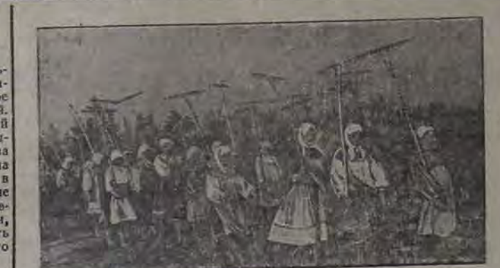
На освобожденной земле. Колхозники сельхозартели «Новый трактор» (Степановский район) жнут на комбайне.

Успешно проведен сев озимых там, как этого требуют интересы страны и фронта. С честью выполнили свои обязательства перед Родиной, перед фронтом, перед товарищем Сталиным!