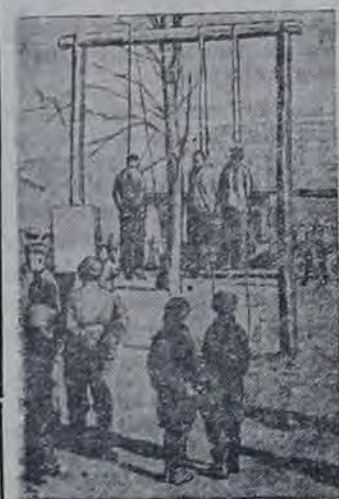
Женщина немецко-фашистской оккупации. На СНИМКЕ: Работы, выполняемые гитлеровцами в районном центре Мозлово (Ленинградская область). (Слева: работы у убитого немца).

Каждый день население деревень вынуждено на дорожные работы или строительство укреплений. Крестьян заставляют бесплатно работать без отхода от урожая до захода солнца. Недавно несколько подростков из селения Новое Хвостовичи ушли и село за хлебом. Фашисты расстреляли их. (ТАСС.)