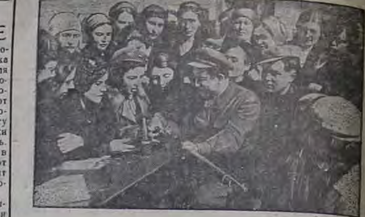
Обучение новому делу — долг каждого гражданина нашей Родины. Выступая перед колхозниками, агитаторы разъясняют им значение и важность уборки урожая. На снимке: агитатор по изучению вытолка, Прокопий Павлович т. Егоров О. А. (Фото А. Г. Малахова).