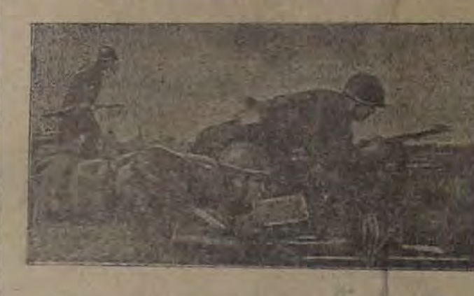
Делегация арки (Завалый фронт). На снимке: Автоматчик воюет бой за овладение высотой под мостом Р.

Множить ряды молодых стахановцев сельского хозяйства