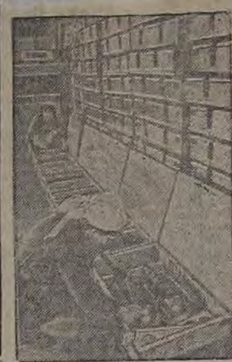
Производство боеприпасов на В-ском заводе, эвакуированном на Восток.

Начало войны: в 9 час. и 11 час. веч. Бомба — с 5 ч. вечера.