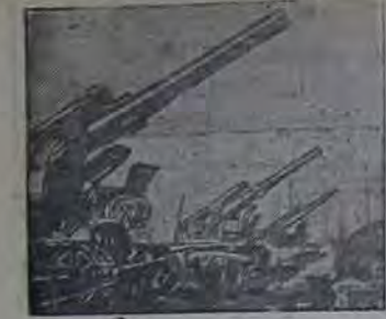
Действующая армия. На СНИМКЕ: Батарея советских самоходных орудий на огневой позиции.

ПОД УДАРАМИ КРАСНОЙ АРМИИ ВРАГ ОТСТУПАЕТ НА ЗАПАД