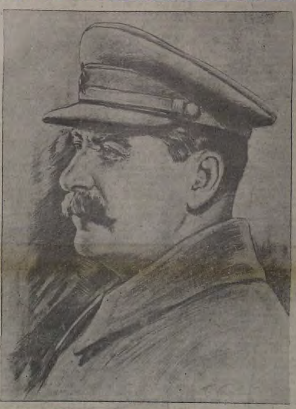
Председатель Государственного Комитета Обороны и Парламентский Комиссар Обороны товарищ П. В. СТАЛИН.

Сегодня 1-е Мая—день смотра боевых сил рабочего класса. На полях сражений, в упорных боях с врагом на фронтах отечественной войны будем демонстрировать сегодня Красной Армии и Военно-Морской Флоту свою несокрушимую мощь и готовность бороться за полный и окончательный разгром немецких захватчиков. В цехах фабрик и заводов, на полях колхозов и совхозов, в советских учреждениях в героическом самоотверженном труде рабочие, колхозники, интеллигенция будут демонстрировать боевое единство фронта и тыла, свою готовность оказать мощную поддержку родной Красной Армии в ее борьбе против гитлеровских разбойников. Мы проведем 1-е Мая в схватках с врагом и в труде для блага нашего социалистического отечества.