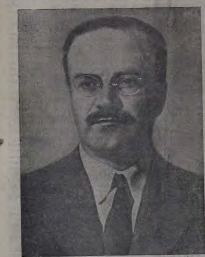
Первый заместитель Председателя Совнаркома СССР товарищ МОЛОТОВ Вячеслав Михайлович