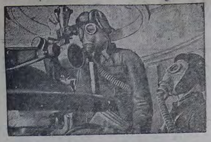
Июльская Армия. На снимке: боевая учеба на бронепоезде «Железнодорожник» и перерыв между боями. Тренировка солдат в стрельбе.

ОРГАН МИНУСИНСКОГО РАЙНОМА И ГОРКОМА ВКП(б) РАЙОННОГО И ГОРОДСКОГО СОВЕТОВ ДЕПУТАТОВ ТРУДЯЩИХСЯ