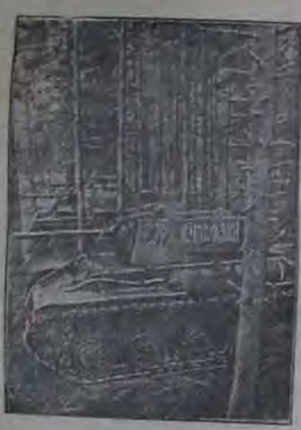
Действующая армия. На снимке: Новая партия советских танков прибыла на переднюю линию.

В училище принимают лица, имеющие образование не ниже 7 классов, в возрасте от 15 до 35 лет. Учащиеся готовят учителей начальных классов. Срок обучения 3 года. Занятия о приеме проводятся на лицейского подчинения с преподавателями: а) сивельности об образовании, б) автобиография, в) трех фотографий, г) справка о состоянии здоровья, д) справка о состоянии здоровья, е) справка о рождении. Прием заявления о приеме производится со дня объявления до 20 августа, заявления с 20 по 25 августа по приемам: русский язык (устно и письменно), арифметика (устно и письменно), география, Конституция СССР. Плата за обучение 150 рублей в год. Дети районного и областного состава, обучающихся в РКБ, освобождаются от платы за обучение. Отличным учащимся предоставляется без оплаты и зачисляется на стипендию. На второй курс принимаются лица, имеющие образование 8—9 классов с воспитанием в объеме 1-го курса училища. При поступлении вносится залоговое обеспечение. Заявления и документы направлять по адресу: г. Минусинск, Красноармейский край, улица имени Красного партиза, № 20, училища. Дирекция.