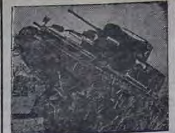
Производство вооружения в Австралии. Испытание 16-тонного австралийского танка.

В районе северо-восточнее Котельниково наши артиллеристы