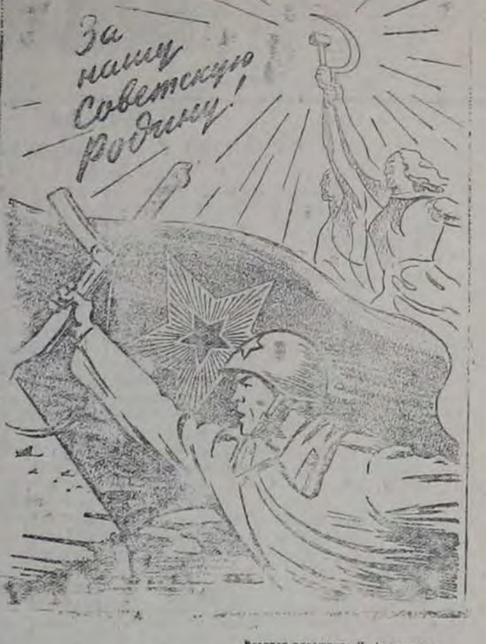
Славя советским войскам, водррузившим знамя победы над Берлином! (Из призыва ЦК ВКП(б) к 1 мая 1945 г.)