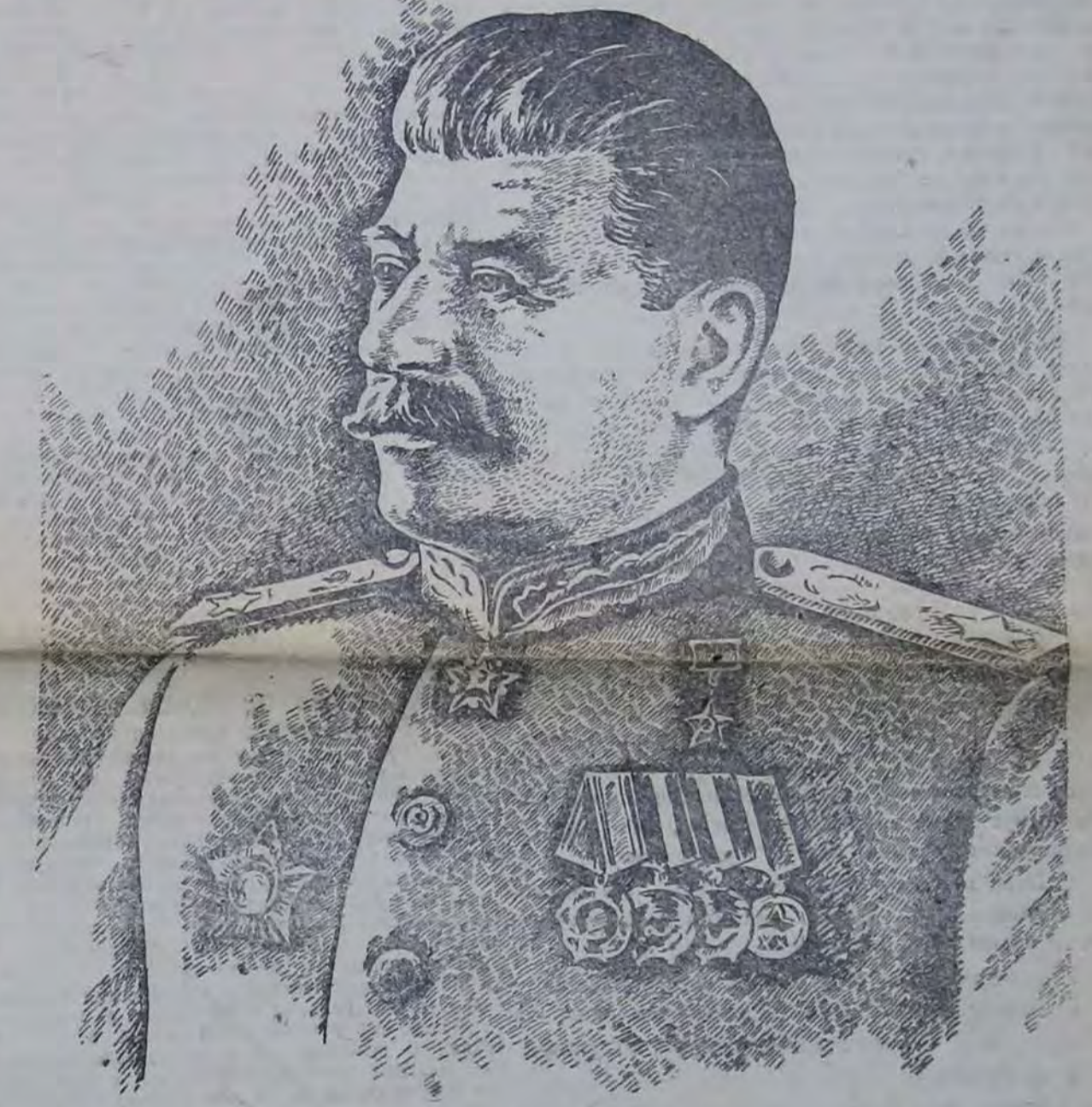
Да здравствует великий вождь народов гениальный полководец товарищ СТАЛИН, под чьим мудрым руководством героическая Красная Армия и советский народ одержали окончательную победу в Отечественной войне!

Совет Народных Комиссаров СССР предложил всем советским государственным учреждениям 9 мая с. г. в день всенародного торжества — Праздника Победы поднять на своих зданиях государственный флаг Союза Советских Социалистических Республик.