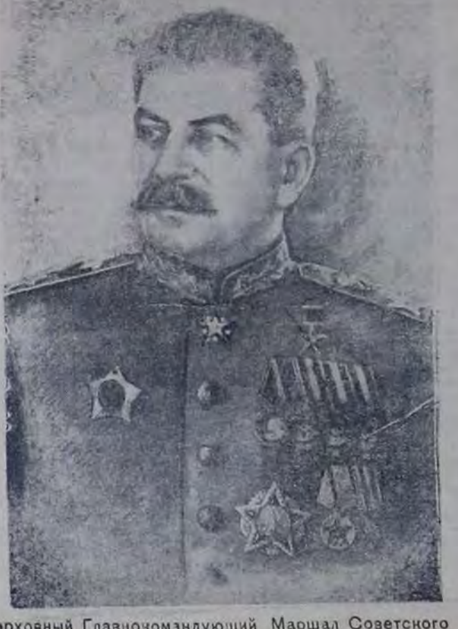
Верховный Главнокомандующий Маршал Советского Союза товарищ И. В. Сталин

Товарищи красноармейцы и краснофлотцы, сержанты и старшины, офицеры армии и флота, генералы и адмиралы! Трудащиеся Советского Союза! Сегодня наша страна празднует 1-е Мая, —Международный праздник трудящихся.