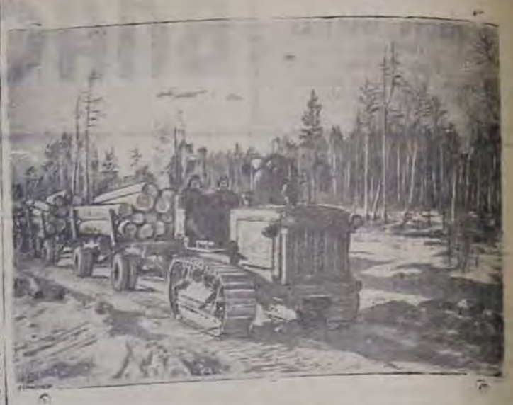
На снимке: вывозка древесины из лесосека на гусеничном тракторе.

После принятия президентом Бенешем отставки реакционных министров было создано новое правительство во главе с прежним премьер-министром Готвальдом. Коммунистическая партия получила в этом кабинете еще более широкое представительство.