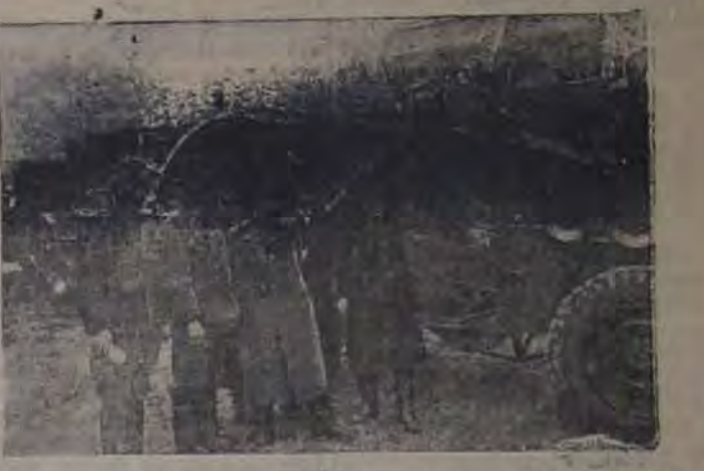
ТАТАРСКИЙ АССР. В этом году на полях колхозов впервые самозащитные бригады. На снимке: колхозники Казанского района. На заднем плане — колхозники в поле. На переднем плане — колхозники в поле.

В колхозе «Взды-Ватыры» создано молодежное звено пахарей, в котором запряжено 14 лошадей. Молодые пахары обязались в 10—12 дней выполнить план вспашки, вспахать каждый прогонным плугом не менее 15 гектаров. Звено молодых бороноволоков из трех колхозников обязалось пахать 6 лошадей забронировать не менее 250 гектаров в два следа. Возврат семян обязуются на каждой лошади довести до нормы не менее 540 центнеров зерна и сенажа. Практически обязательства взяли на себя прадедьями. Ябач О. МАТЫГУДИНА.