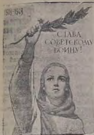
Плакат работы худ. В. Иванова, выпущенный издательством «Искусство».