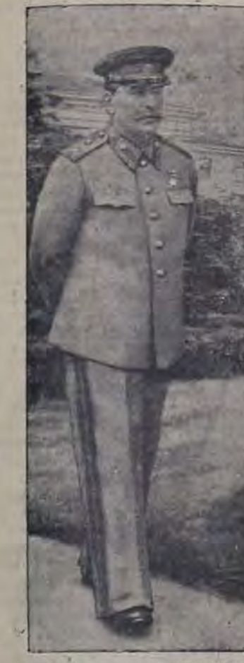
Иосиф Виссарионович СТАЛИН

Колхозники Кубышевской области обязуются выполнить государственный план хлебозаготовок досрочно—к 25 октября 1948 года, увеличив поголовье крупного рогатого скота на колхозных фермах на 18 процентов, по сравнению с 1947 годом; расширить посевные площади овсе-бахчевых культур и картофеля в колхозах области на 67 процентов. (ТАСС).