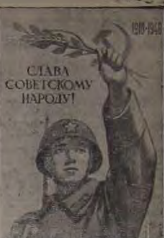
Плакат работы худ. В. Иванова, выпущенный издательством «Искусство».

Иде же источник военной и трудовой славы и славы этих замечательных людей? Им — это — многообразный советский патриотизм. Г. СЫСОЛТАН.