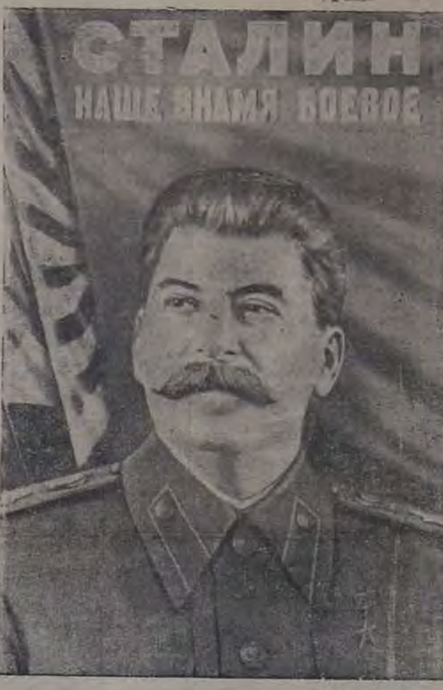
Плачет работы худ. И. Шагина и А. Дружкова, выпущенный издательством «Искусство».

Ныне, в мирных условиях, Советская Армия доблестно охраняет завоеванный мир и сознательный труд нашего народа. Повышая свою боевую и политическую подготовку, Вооруженные Силы страны Советов твердо стоят на страже первого в мире социалистического государства.